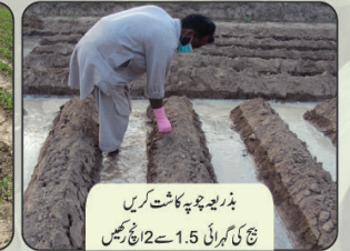
بذر لیچ چوپہ کاشت کریں چ کی گہرائی 1.5 سے 2 اچ رہیں