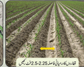
قطاروں کا درمیانی فاصلہ 2.25-2.5 فٹ رہیں