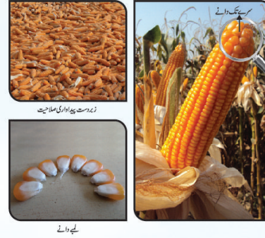
زبردست پیداواری صلاحیت